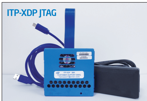
※仕様と構成は予告なく変更する場合があります。